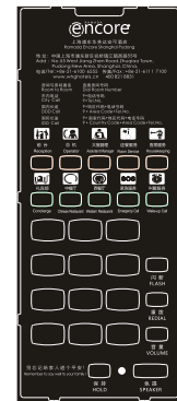
型号: PT-65 B(Y) Model: PT-65 B(Y)