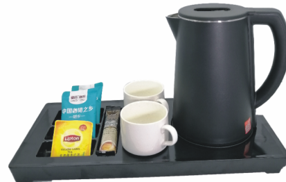
PD-001 托盘 PK-26 水壶套装