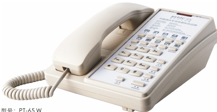
型号: PT-65 W Model: PT-65