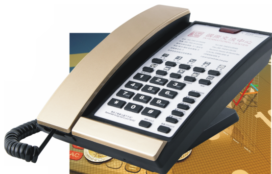
型号\Model : PT68-BG