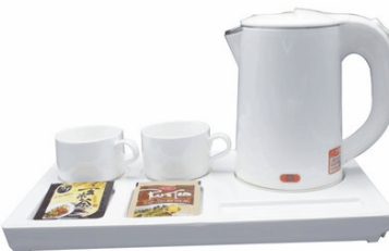
PK-28 套装托盘 规格/Size: 360*206 mm