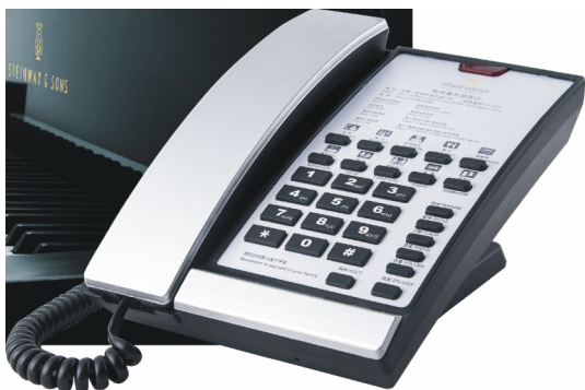
型号\Model : PT68-BY

Unique use of piano paint technology, wear-resistant, anti discoloration