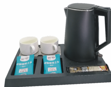
PD-005 托盘 PK-20 水壶套装