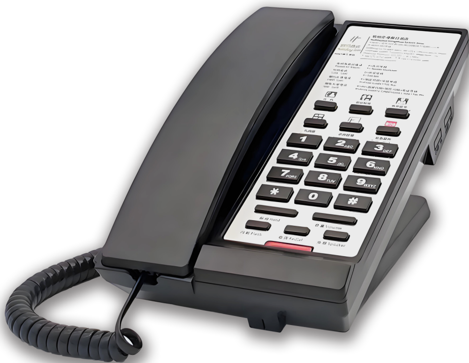
型号\Model : PT98-B 酒店客房专用电话机 黑色