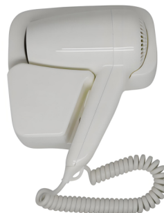
型号/Model: PH-511B 功率/Power: 1200w~220v/50Hz 规格/Size: 95*175*210mm