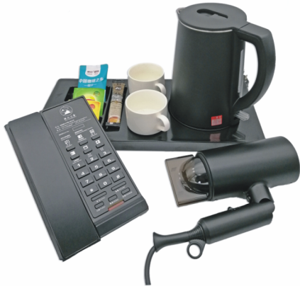
客房电器哑黑系列搭配组合