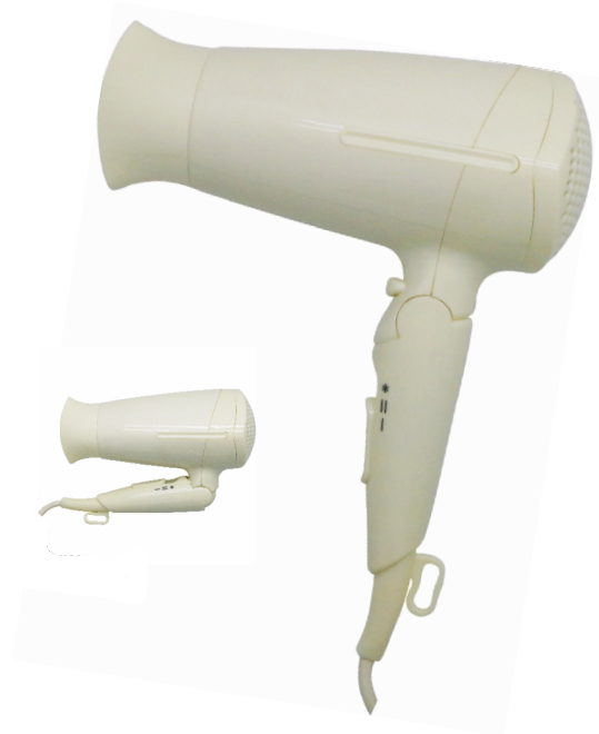
型号/Model: PH-516 W 功率/Power: 1600w 颜色/Colour: 米白色/Lvory

双层可拆卸进风网， 便于清洁 Double layer detachable into the net, easy to clean