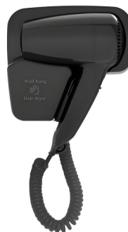
型号/Model: PH-511B2 挂墙电吹风 功率/Power: 1200W ~220V/50Hz 颜色/Colour: 黑色/black