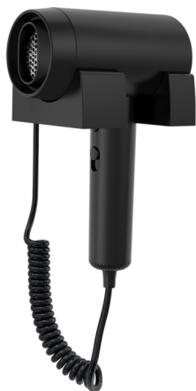
型号/Model: PH-514 挂墙电吹风 颜色: 黑色 功率: 1600W