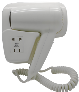
型号/Model: PH-511A(带插座) 功率/Power: 1200w~220v/50Hz 规格/Size: 95*175*210mm