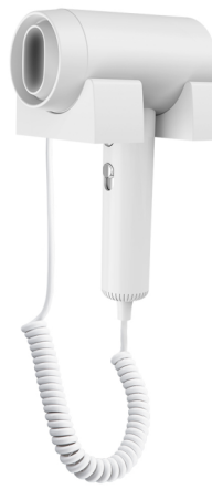
型号/Model: PH-514 挂墙电吹风 颜色: 白色 功率: 1600W