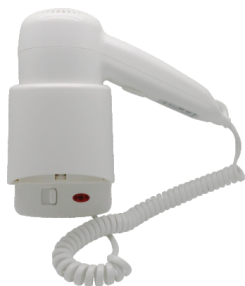
型号/Model: PH-510B 功率/Power: 1200w~220v/50Hz 规格/Size: 110*215*210mm