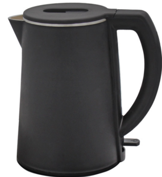
PK-26 B 磨砂皮纹 哑黑