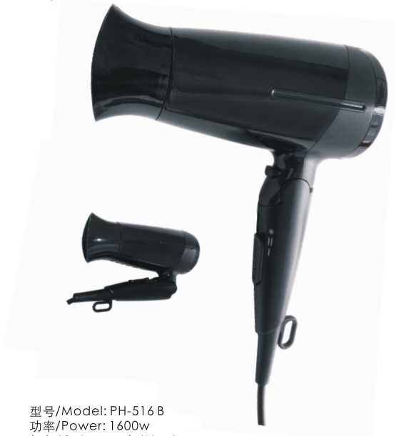
型号/Model: PH-516 B 功率/Power: 1600w 颜色/Colour: 黑色/Black