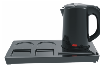
PD-003 托盘 PK-28 水壶套装