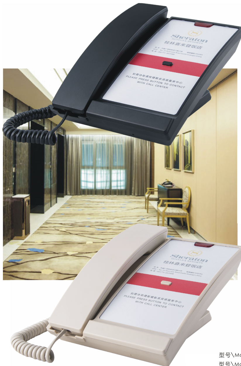
型号\Model : PT68-B+1 黑色 型号\Model : PT68-W+1 米色

酒店公共区域电话机，主要指放置在酒店大堂、走廊、各功能服务间的电话，通常只保留一个服务按键，按下此键可以直接接通到总机或前台