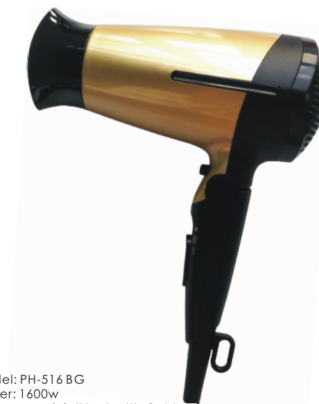
型号/Model: PH-516 BG 功率/Power: 1600w 颜色/Colour: 黑配金色/Black with Gold